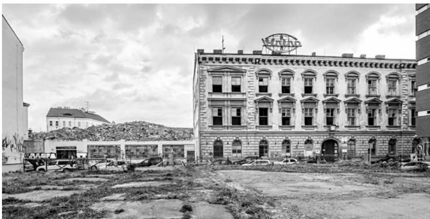
Devastovaný bývalý Bochnerův palác s ruinami továrny Bratři Stiassni. Stav v dubnu 2017.