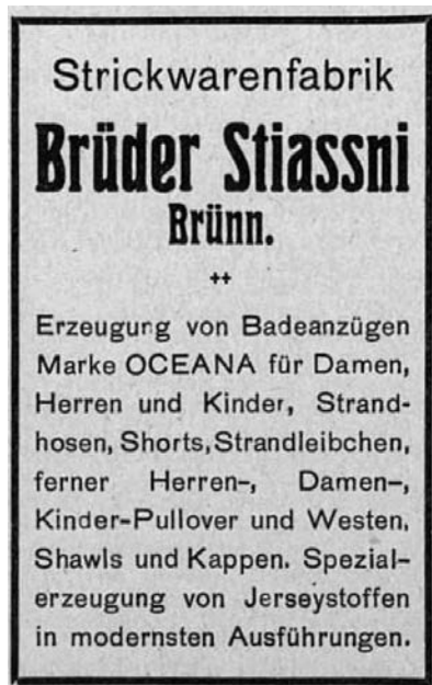
Inzerát na produkci továrny Bratři Stiassni. (reprodukováno z: Adresář Protektorátu Čechy a Morava pro průmysl, živnosti, obchod a zemědělství, 1939)