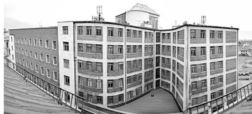
Palác Morava stavěný původně jako hotel Stiassni.