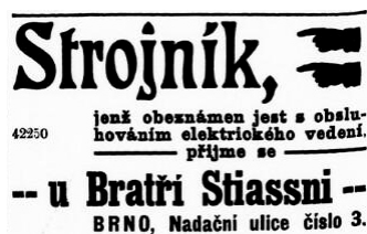
Inzerát poptávající kandidáty na pozici strojíka v továrně. (reprodukováno z: Moravská Orlice, 1906)

vypisována nejméně týden dopředu na stránkách denního tisku. Účast na přesčarových směnách byla pro dělníky povinná, nicméně placená. Redaktoři deníku velmi nevybíravým způsobem vybízejí dělníky k protestům a demonstracím a také k založení „rudých odborů“, ideálně k následování vzoru v továrně Mořice Berana synové – cílem bylo zavedení pravidelné sedmihodinové pracovní směny a navýšení mezd. Zde stojí za zmínku, že továrna Mořice Berana synové v důsledku krize zcela zbankrotovala a část jejích provozů zakoupila právě továrna Bratři Stiassni.