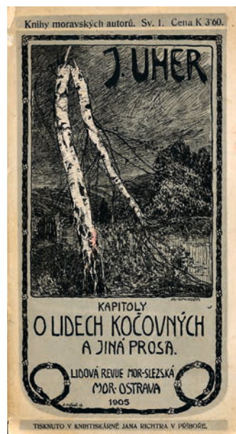
Přebal prvního vydání Kapitol o lidech kočovných