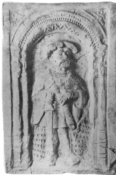
Obr. 5 / Portrét panovníka, kachel, Levín. (převzato z: Zápotocký Milan, Katalog středověké keramiky severočeského Polabí, 1979, obr. 31:21)

Bohatý oděv šlechtice (pštroší péra na baretu, kožešina, šperky, meč) poukazují na to, že se jedná o portrét panovníka. Nemáme však k dispozici žádné další vodítko, které by pomohlo spolehlivě identifikovat konkrétní historickou osobu (nápis, erb). Volná analogie motivu, pocházející z Levína, je ve starší literatuře uváděna jako portrét Jana Fridricha I., kurfiřta Saského, 31 panovníka, který byl častým námětem výzdoby kamnových kachlů. I když se nám nepodařilo dohledat grafickou předlohu, která by jednoznačně potvrdila osobu na reliéfu, kompozice, oděv i postoj šlechtice vykazují poměrně velkou shodu s portréty Jana Fridricha I. (např. rytiny Goerge Pentze, nebo možná spíše některá z pozdějších variací téhož motivu, obr. 4c, d), 32 mohlo by se však jednat i o portrét některého z dalších panovníků doby reformace (např. Fridricha III. Moudrého).