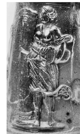
Obr. 2 / Alegorie Síly a) grafický list Heinricha Aldegrevera 1528. b) reliéfní výzdoba korbele provedená podle rytiny H. Aldegrevera.