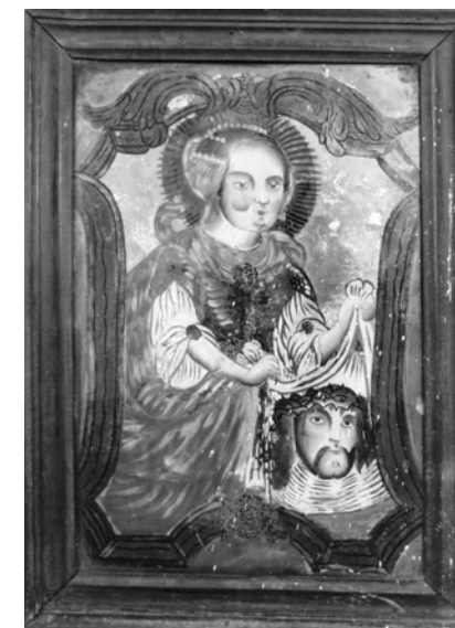
Sv. Veronika, Českomoravská vysočina – západní Morava, přelom 18. a 19. století. (Muzeum v Ivančicích)

Na přelomu 18. a 19. století se vyhranila další varianta lidového malířství na Českomoravské vysočině. Zdejší produkce je osmi reprezentanty zastoupena ve sbírce ivančického a Podhoráckého muzea a řadí se tak k nejčetnějším regionálnějším typům sbírkových fondů. 28 Tamní podmalby se vyznačují nevýraznými konturami okrové nebo tělové barvy, případně tenčími černými liniemi. Z charakteristických detailů je možno zmínit květinový dekor v podobě festonů z květů růží a palmetových lístků. Část podmaleb má dělené pozadí, přičemž vnitřní tvoří zrcadlová