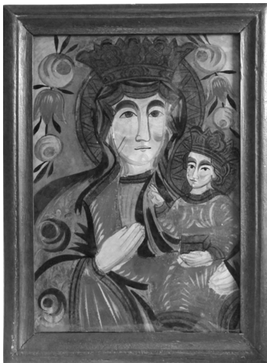
Panna Maria Čenstochovská, Ždánice, dílna tzv. malíře štětcem malovaného (huňatého) obočí, 1. polovina 19. století. (Muzeum ve Šlapanicích, foto: L. Libicharová)

plocha, např. aureoly kolem hlav světců (ve sbírce u sv. Jana Nepomuckého). Podle výskytu lze předpokládat, že se tento typ utvářel především v předpokládaných dílnách u Českých a Moravských Křižánek, Herálce nebo v přilehlé části západní Moravy a východních Čech.