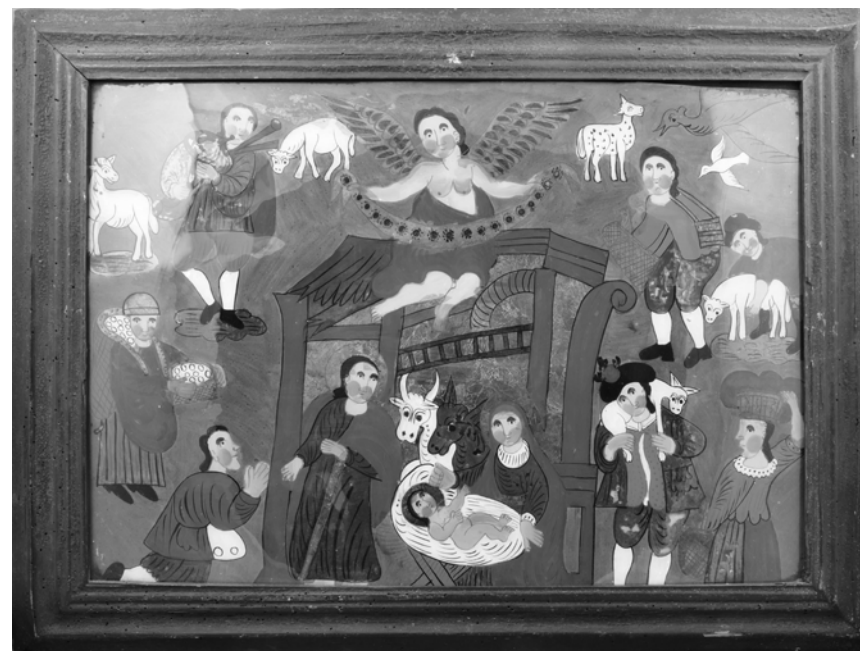
Narození Páně – Brněnsko, dílna tzv. malíře vysoce klenutého obočí, 1. polovina 19. stol. (Podhorácké muzeum, foto: H. Fadingerová)

Tzv. malíř vysoce klenutého obočí představuje z výtvarného hlediska patrně neoriginálnější osobnost lidové podmalby na území českých zemí. Jeho díla se na jedné straně vyznačují svěbytnou výtvarnou zkratkou, která prozrazuje zručného kreslíře. Na druhé straně oplývají nespornou naivitou výrazu oceňovanou jako typický znak lidového umění. Postavy s kruhovými obličejí, do oblouku klenutým obočím a usmívajícími se rty působí neobyčejně optimistickým dojmem. K radostnému vyznění malířových děl přispívá barevné ladění, kterému dominuje zářivá