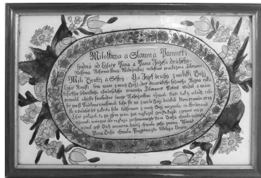
Připomínka tolerančního patentu, jižní Morava (okolí Ždánic – širší Brněnsko), 1. třetina 19. století. (Muzeum v Ivančicích, foto: B. Svobodová).

Vývoj sbírek se v podstatě uzavřel před několika desetiletími. Výraznější obohacení kolekcí není v budoucnosti pravděpodobné vzhledem ke vzrůstající tržní ceně těchto předmětů a jejich obtížnější dostupnosti.