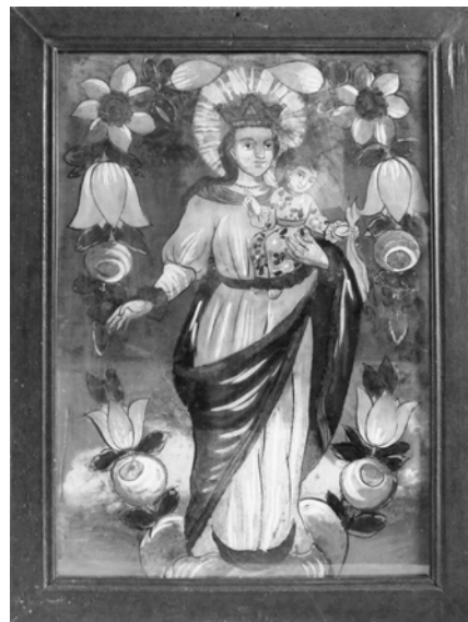
Panna Maria Hostýnská, širší Brněnsko, skupina dekoru růží a tulipánů, konec 18. století. (Muzeum ve Šlapanicích)

První moravští tvůrci pracující pro lidové odběratelské vrstvy navázali na tradice provinčního pozdně barokního malířství. Remeslnou produkci, která je na vyšší malířské úrovni a je genetickým východiskem zlidovělé malby na skle, zastupují čtyři exempláře ivančického muzea: zobrazení Panny Marie, jež je provenienčně obtížně zařaditelné, rytina do zlaté folie se sv. Ignácem, nejspíše vzniklá v okruhu řádového prostředí jako tzv. klášterní práce, a znázornění Adama a Evy, které nese znaky rustikalizace a vykazuje paralely s pozdější malbou Českomoravské Vysočiny. 23 Specifickým příkladem je podmalba sv. Eustacha 24 pocházející