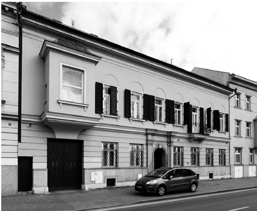
Dům č. o. 104, současný stav.

dřevěné okenice. Stavbu zakončuje korunní římsa, která nese sedlovou střechu. Dům si přes množství detailů uchovává střízlivé neoklasicistní formy.