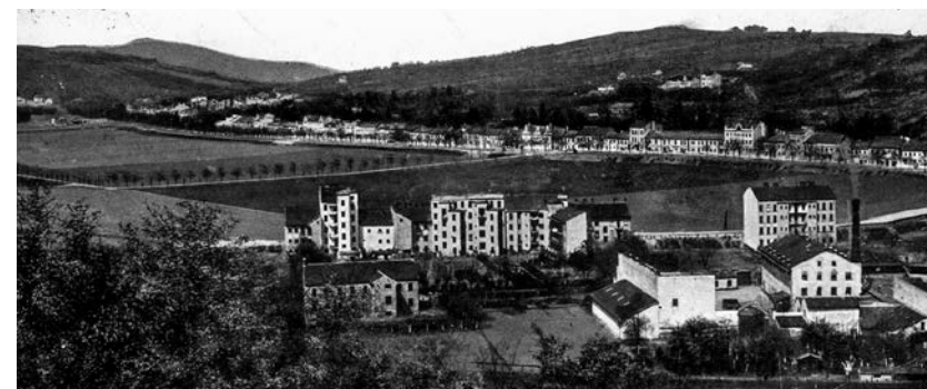
Ulice Hlinky v roce 1912. (historická pohlednice, publikováno s laskavým svolením Nakladatelství Josef Filip)

s vozovnou na jejím konci. Koněspřežku (1870) vystřídala tramvaj, nejprve parní (1884) a nakonec elektrická (1900). Stavební dějiny ulice Hlinky dosud nebyly navzdory její výstavnosti v celku zpracovány. Až na výjimky není mnoho známo ani o jednotlivých domech. 1 Dosavadní bádání nicméně přineslo pozoruhodné zjištění, že celou řadu objektů na této ulici spojovaly majetkové držby. 2,3