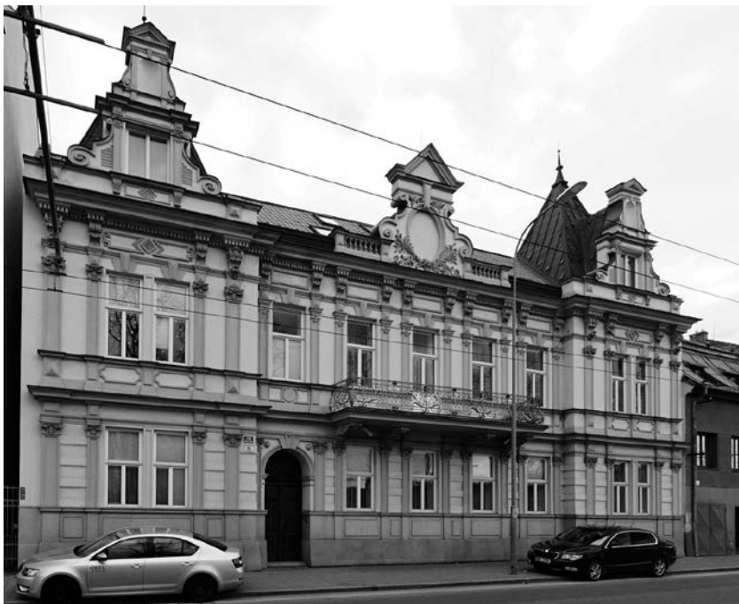
Dům č. o. 86 na ulici Hlinky, současný stav.

pouze vstup situovaný vlevo od centrální osy. Fasádu nad obložení soklu člení nepravá pásová bosáž v přízemí a pilastry v obou patrech. K hladce osazeným oknům se na průběžných podokenních římsách připojují obdélné parapetní výplně, v patře je navíc v horní části vložen klenák. Tři střední osy v patře doplňuje balkon s jemně tepaným zábradlím. Kompozici průčelí gradují postranní rizality zakončené atikovými bohatě formovanými štíty, jakož i nad balkonem centrální atikový štít s vepsaným slepým oválným otvorem. Vila postavená ve stylu pozdního historismu, s četnými eklektickými detaily, svým subtilním pojetím odpovídá charakteru francouzské renesance. Z katastrálních map města Brna ze začátku 20. století vyplývá, že rozsáhlou zahradu si Karpelesovi upravili na park.