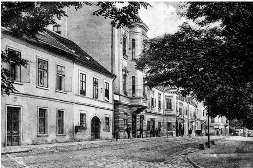
Reprezentační zástavba na ulici Hlinky na počátku 20. století, už tehdy byla ulice lemována stromořadím; na snímku je i dům č.o.72. (historická pohlednice)