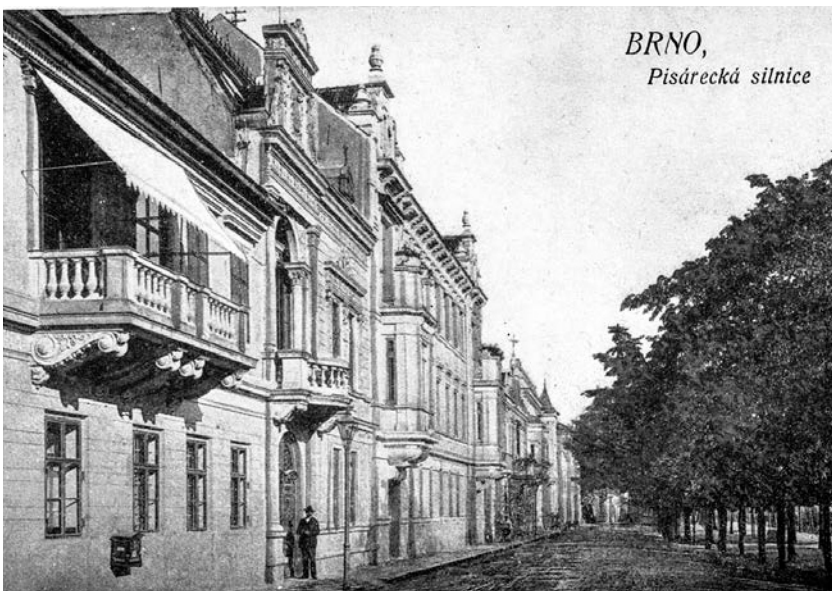
Domy na Hlinkách č.o. 116, 114 a 112 na počátku 20. století. (historická pohlednice)

Pisárky si na konci 19. a v prvních desetiletích 20. století Löw-Beerové oblíbili jako místo svého rodinného bydlení. Konkrétně na ulici Hlinky lze jejich stopy vysledovat u celé řady domů (čísla orientační 72, 86, 96, 104 a 114, a okrajově i 40 a 42) a jedné samostatně stojící vily (č. o. 132). 4 V nejbližším okolí Hlinek pak vlastnili či obývali ještě další nemovitosti (Vinařská č. o. 4, Výstavní č. o. 15, Kalvodova č. o. 8, Pellicova č. o. 73, stavební parcely na Žlutém kopci). Jednalo se o reprezentanty dvou samostatných společností: firmy Aron und Jakob Löw-Beer's Söhne (založena 1853) a firmy Moses Löw-Beer (založena 1847), čili o potomky tří bratrů Arona (1782/3–1849), Jakoba (1786–1864) a Mosese (1793/4–1851), synů Salomona Löw-Beera (1746–1832) a Pauliny roz. Kolin (1753–?).