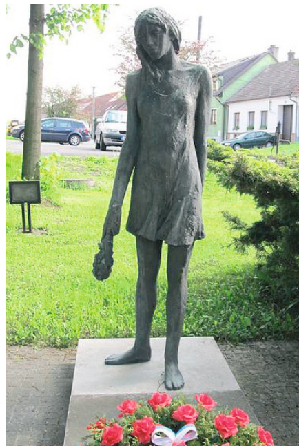
Z. Řehořík, Památník obětem II. světové války v Křižanově z roku 1988.