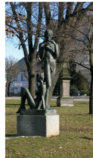
Z. Řehořík, Sousoší Hudba, 1992, Třebíč. (převzato z: L. Matoušková, Zdeněk Řehořík. Třebíčský zpravodaj č. 4, 2016)