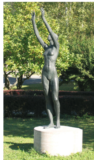
Z. Řehořík, Energie života, 1989. Socha umístěna před obchodním domem v Nedvědicích.