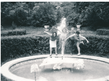
Dívky z Domova mládeže u fontány, v pozadí socha Cvičenka, pravděpodobně jaro 1987.